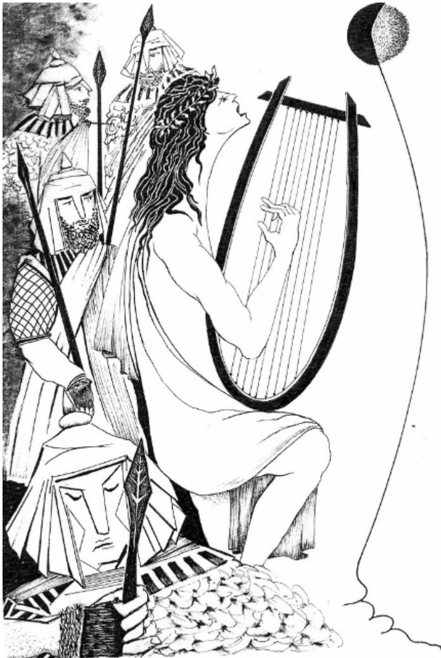
Orphée et les bergers