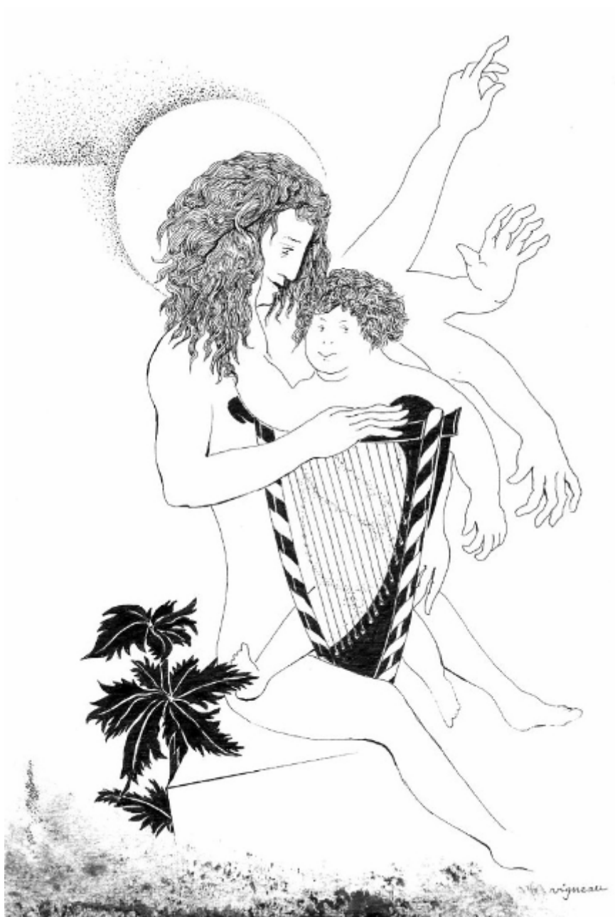
Apollon et Orphée enfant