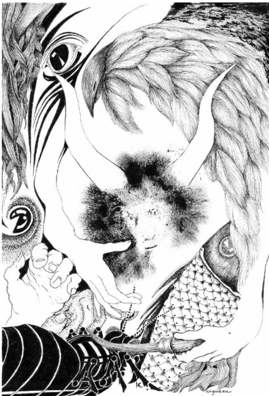
Le désordre du monde