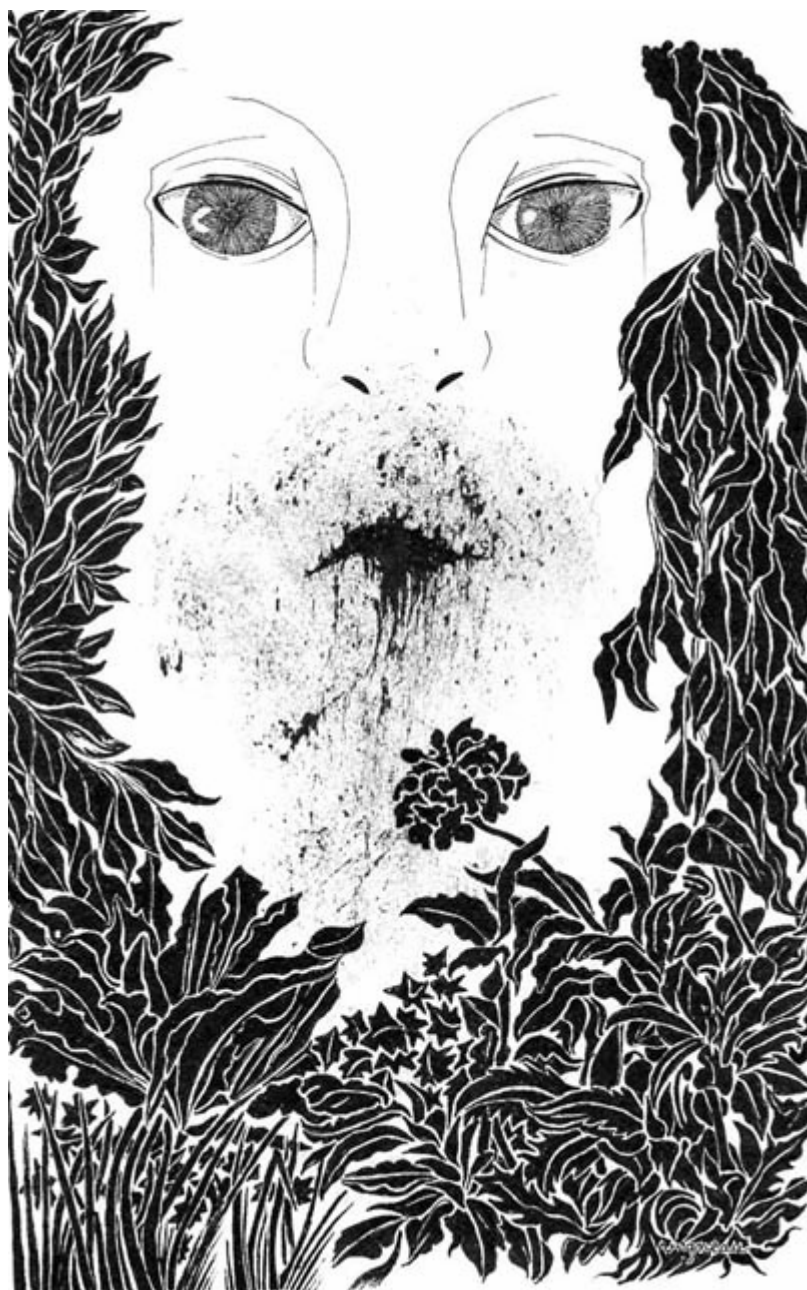
Un satyre écoute