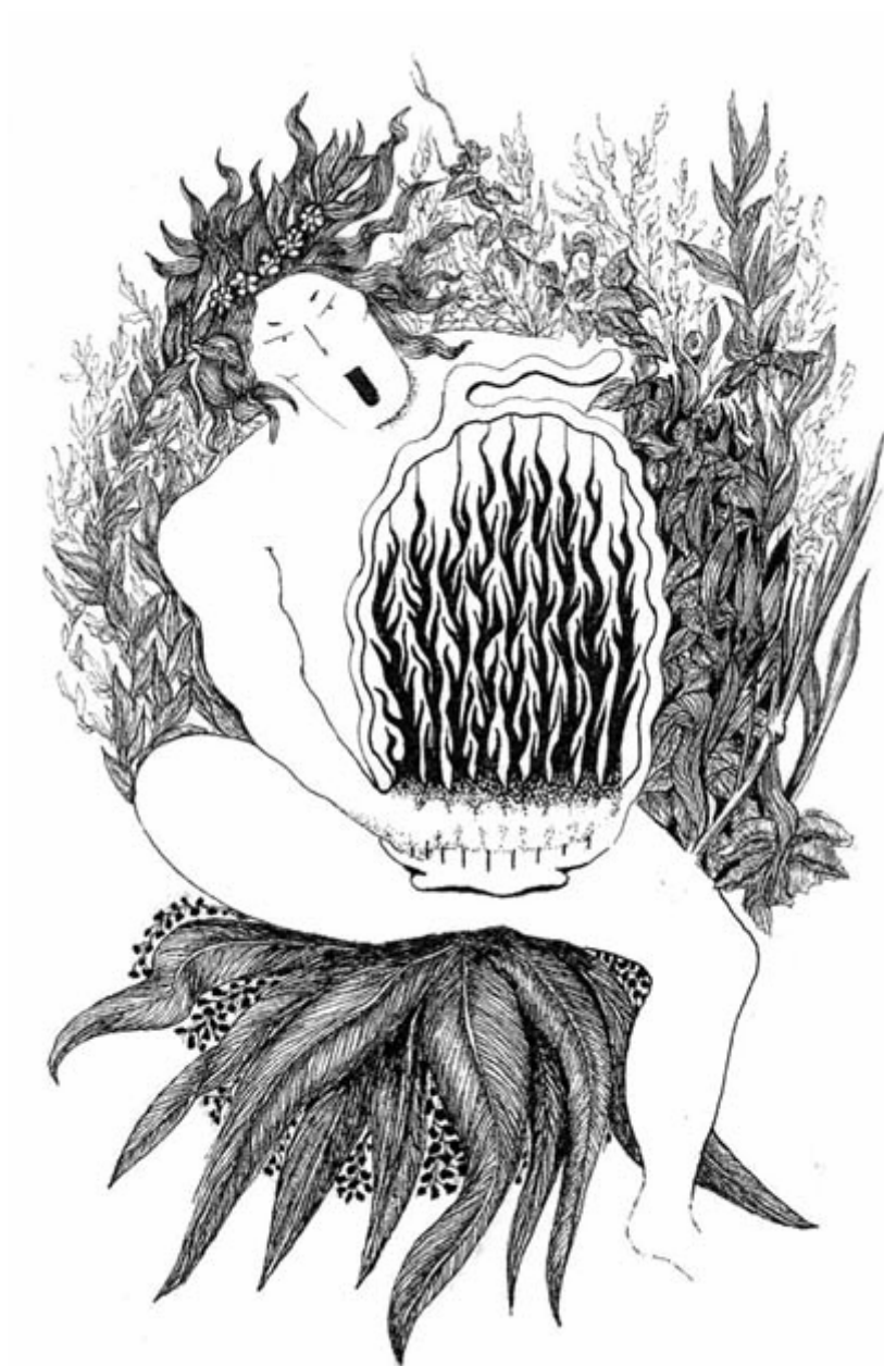
Orphée charme le végétal