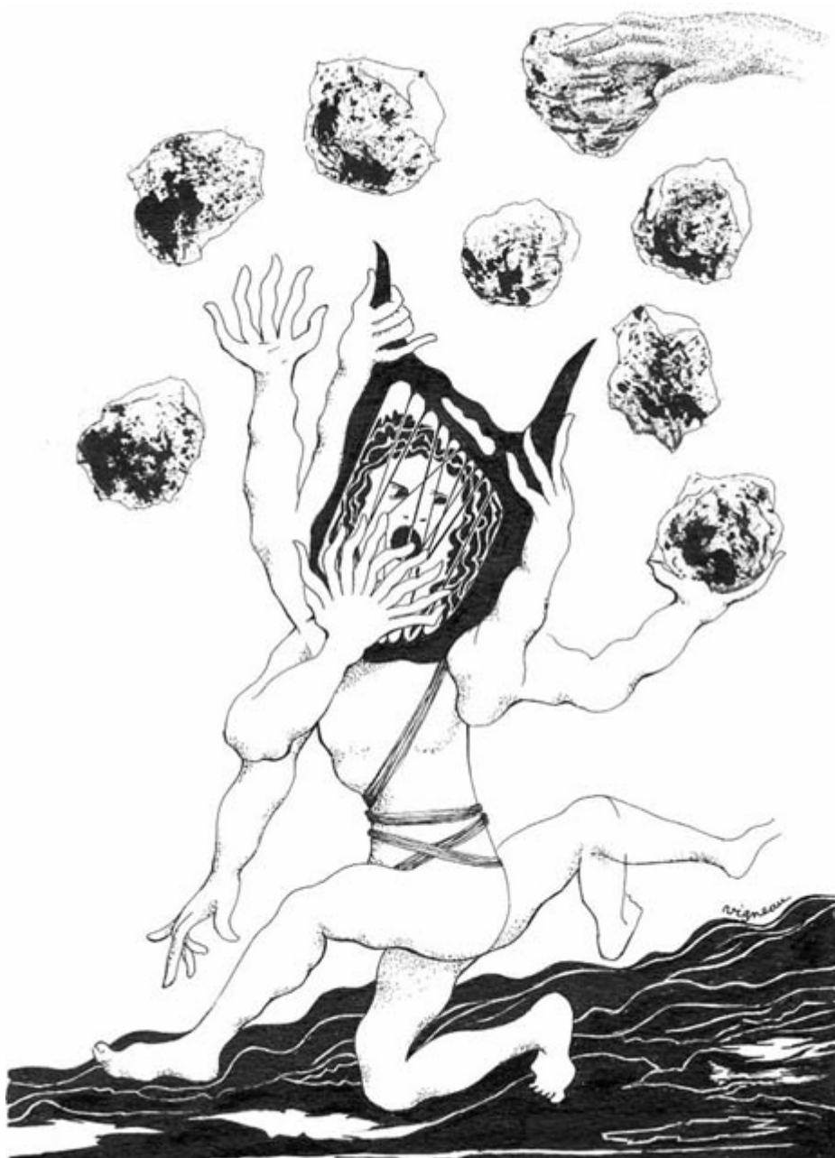
Orphée charme le minéral