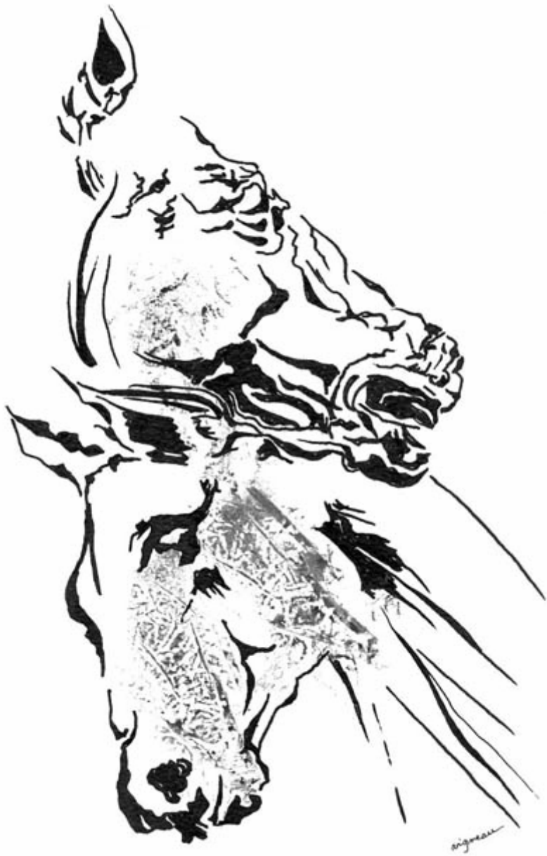
Les dieux aveugles