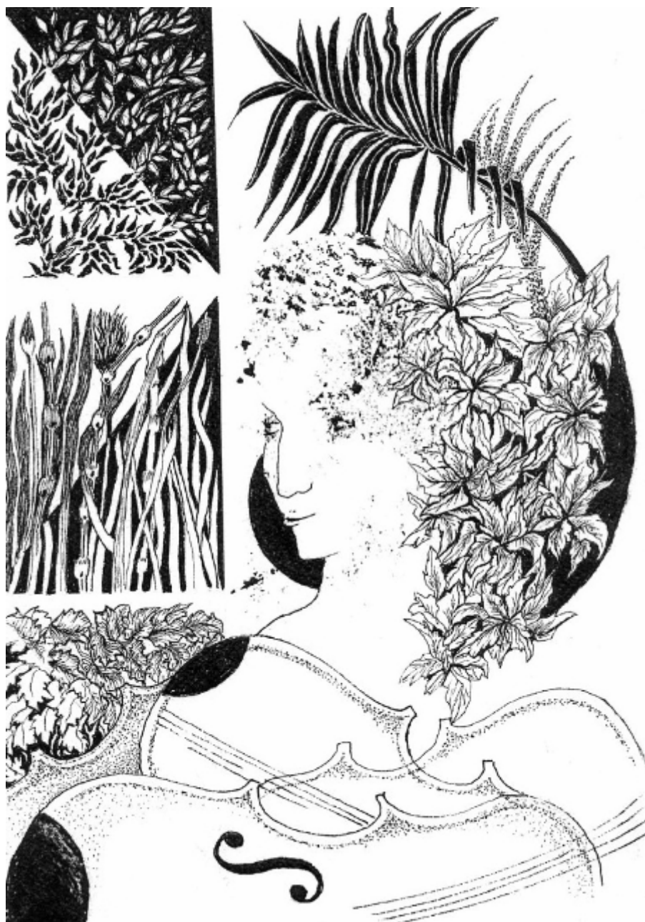
Les bruits du monde