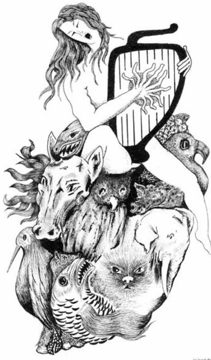
Orphée charme l'animal